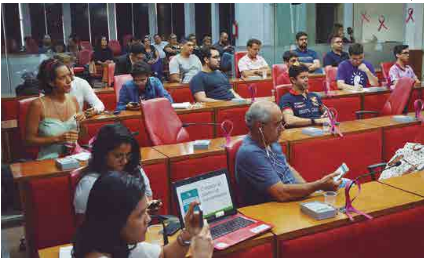
População e vereadores que usaram a tribuna ressaltaram que vedação do uso de canudos de plástico segue tendência mundial pela preservação do meio ambiente

Todos que usaram a tribuna destacaram que a vedação do consumo de canudos de plástico é uma tendência mundial como forma de contribuir com a preservação do meio ambiente, uma vez que o produto representa 4% de todo lixo do mundo e leva cerca de 500 anos para se decompor. Eles ainda esclareceram que exist