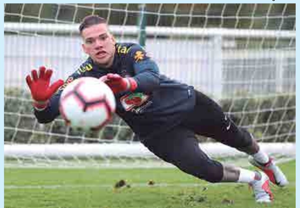
O goleiro Ederson ganha oportunidade e será titular no jogo contra a Arábia Saudita na sexta