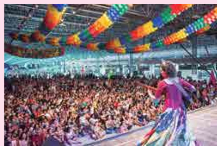
Praça do Povo do Espaço Cultural em show do grupo Carroça de Mamulengos

Palco de shows nacionais e internacionais, a Sala de Concertos Maestro José Siqueira tem capacidade para 576 pessoas. Os interessados podem buscar a Gerência de Eventos, que funciona no Espaço Cultural, bloco administrativo, rampa 1. O horário