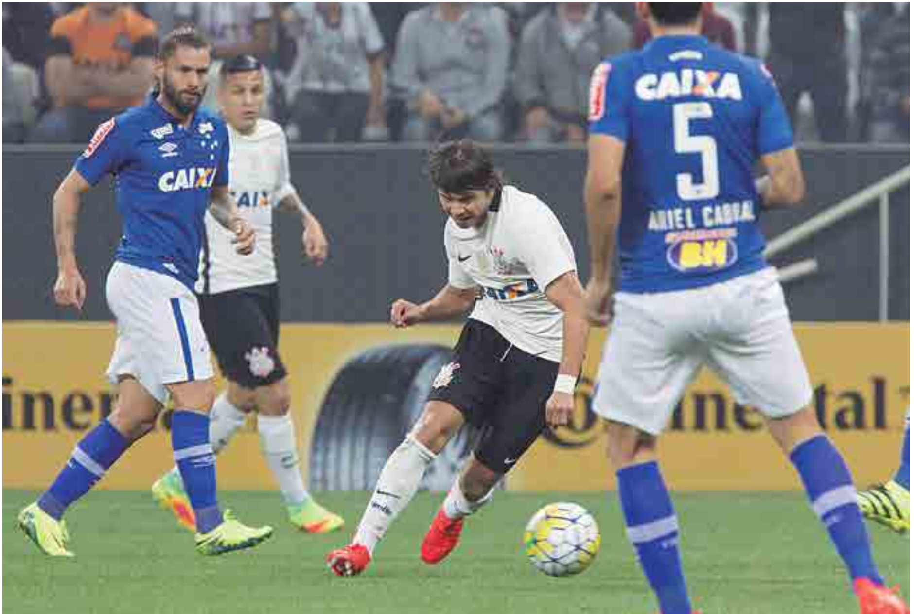
O Corinthians do atacante Romero deve usar hoje contra o Cruzeiro, no primeiro jogo da final da Copa Brasil, a mesma estratégia que usou no confronto diante do Flamengo fora de São Paulo

Corinthians e Cruzeiro já estiveram frente a frente em uma decisão, em 1998, mas pelo Campeonato Brasileiro. Naquele ano, a fase decisiva era disputada em melhor de três partidas. E a equipe paulista levou a melhor: O primeiro jogo, em Belo Horizonte, terminou empatado por 2 a 2. Houve novo empate no segundo, em São Paulo, por 1 a 1. No terceiro e decisivo, o Corinthians garantiu a taça com uma vitória por 2 a 0.