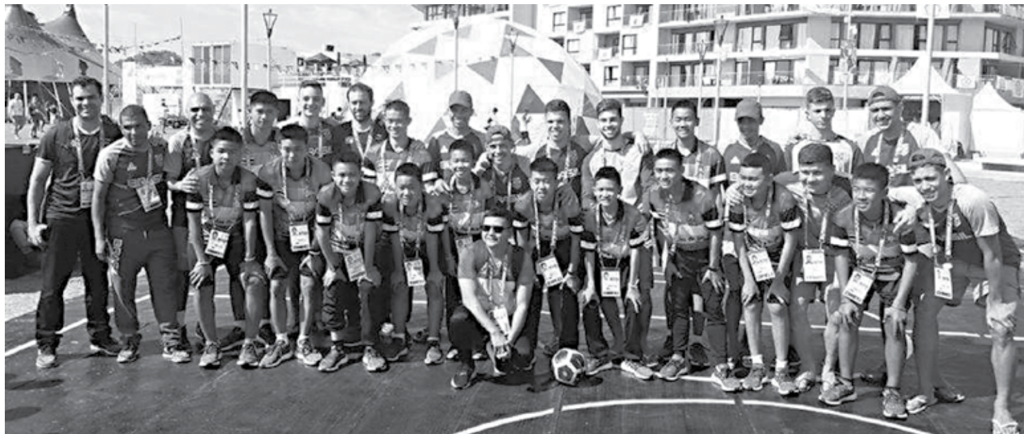
Javalis Selvagens e jogadores brasileiros de futsal posam após uma partida de futebol amistosa durante os Jogos Olímpicos da Juventude