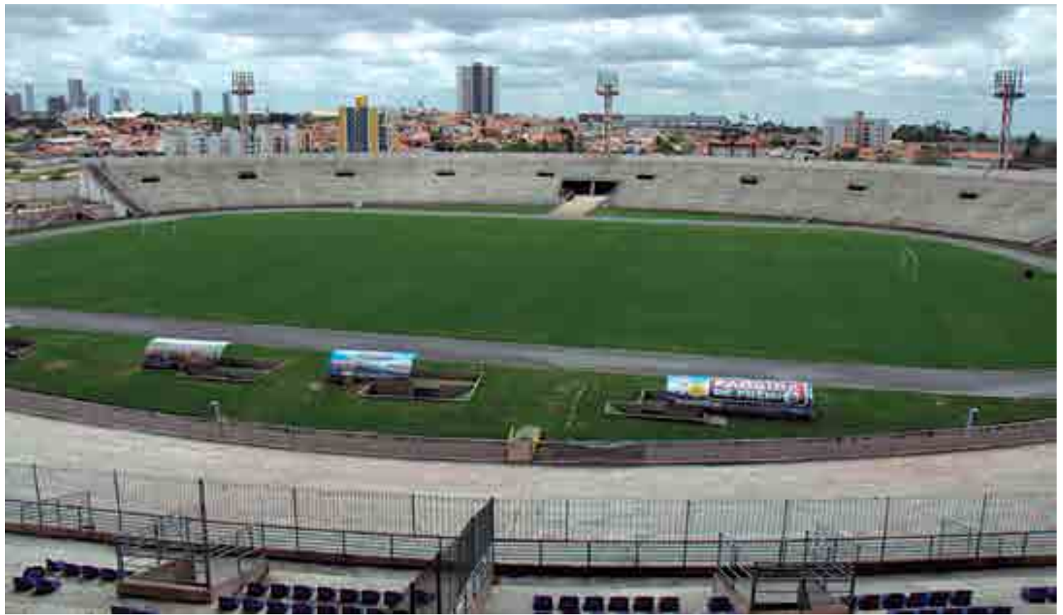
O Estádio Amigão ganha um gramado padrão Fifa graças à intervenção do Governo do Estado, que tem investido bastante no esporte paraibano

As melhorias no Amigão, estão sendo concluídas pela empresa paulista Campanelli, escolhida mediante licitação promovida pelo Governo do Estado. Cabe à Suplan a fiscalização de tudo que está sendo feito na praça de esportes. O gramado do Estádio de Campina Grande está no mesmo padrão do Estádio Almeida, de João Pessoa e dos estádios que sediaram partidas da Copa do Mundo de 2018.